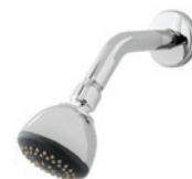
Regadera Redonda Autolimpiadora ABS 7.5 cm COD. SG0049863061BO